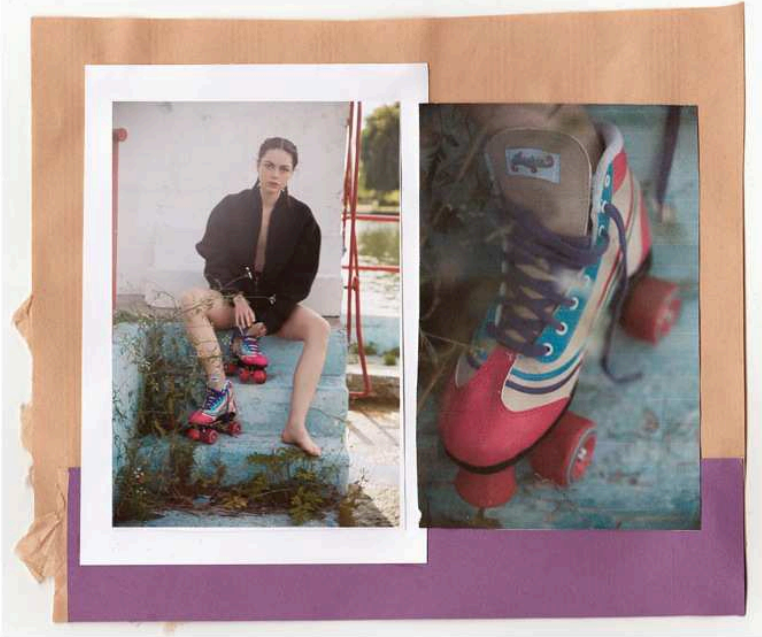
patins Urban Outfitters