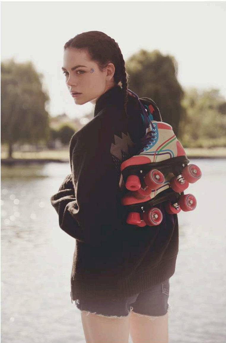
bomber Amish Boyish