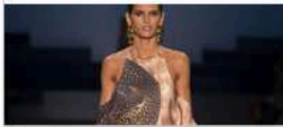
Agua de Coco