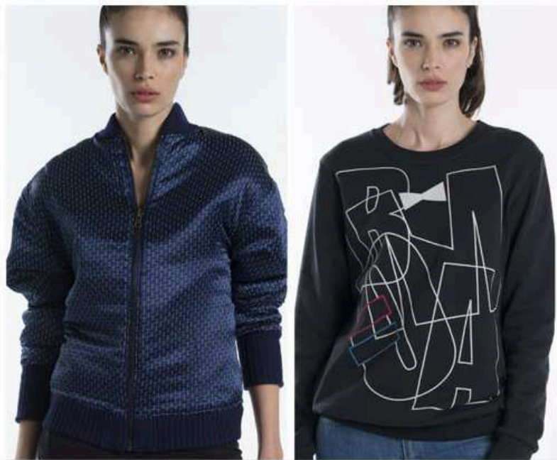
AmishBoyish automne-hiver 2014/2015.