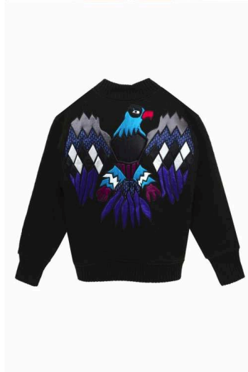
Bomber réversible « Eagle », Amish Boyish, 820€ chez Modetrotter